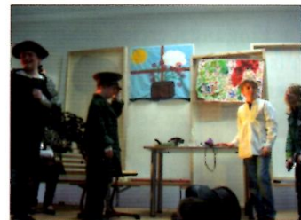
Die Schutzmänner werden gerufen.