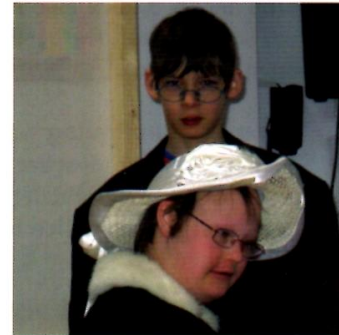
Eine feine Dame und ein feiner Herr